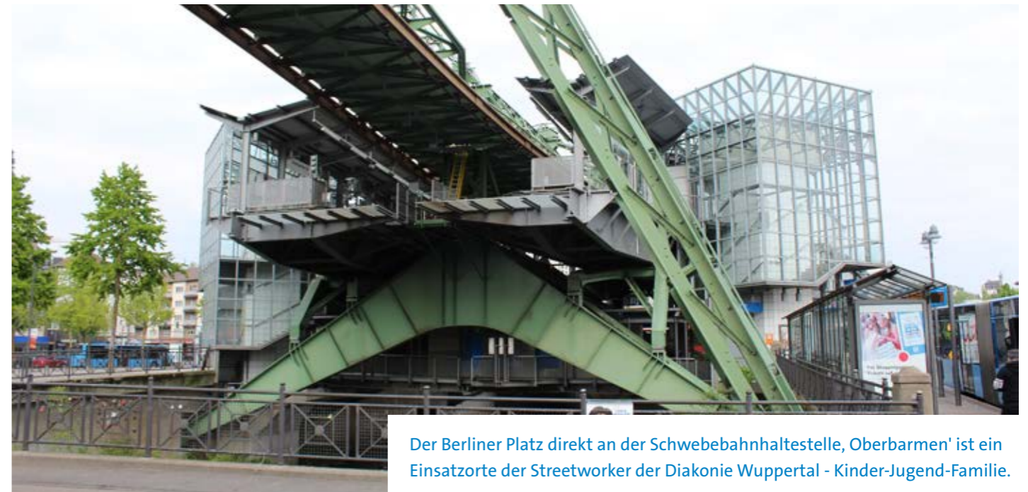
Der Berliner Platz direkt an der Schwebbahnhaltestelle, Oberbarmen' ist ein Einsatzort der Streetworker der Diakonie Wuppertal - Kinder-Jugend-Familie.

Die genaue Größe der Gruppe ist schwer einzuschätzen, so Book. Etwa 15 bis 20 Kinder und Jugendliche, überwiegend im Alter unter 14 Jahren, aus allen sozialen Schichten gehören zur Gang. Die Kinder begehen die Straftaten mit dem Bewusstsein, dass sie in diesem Alter nicht strafmündig sind. Mit dem 14. Lebensjahr hören die kriminellen Handlungen bei einigen auf und sie treten in den Hintergrund, so Book. Dass Jugendliche straffällig