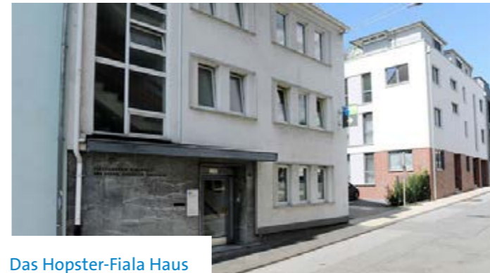
Das Hopster-Fiala Haus

vier Betroffene Ambulant Betreutes Wohnen an. Ein weiteres großes Problem: Etwa die Hälfte der Frauen hat Kinder. „Frauen mit Kindern halten sehr viel Gewalt aus, wenn sie in Abhängigkeit von einem Mann wohnen“, weiß Lieto. Eine Unterbringung in der Notschlafstelle im Hopster-Fiala-Haus für obdachlose Frauen bedeutet eine Trennung von den Kindern. Sie werden gesondert in der Kinderschutzstelle untergebracht.